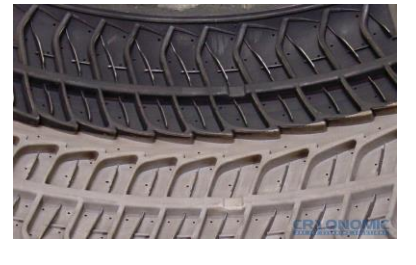
ทำความสะอาดแม่พิมพ์ยาง