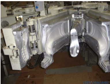
กำจัดรอยยาง