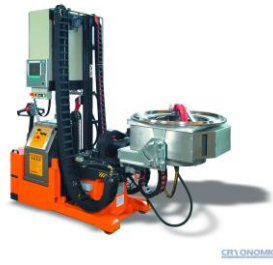
ทำความสะอาดแม่พิมพ์ อัตโนมัติ