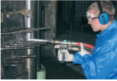
ทำความสะอาดถาวรร้อน จากแม่พิมพ์